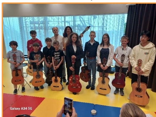
Interní koncert kytarového oddělení 23.5.2024