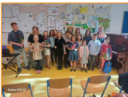
Interní koncert v ZŠ Šestajovice 22.5.2024

Výhled na školní rok 2024/2025 pro Základní uměleckou školu FLOW – Základní umělecká škola a středisko volného času se nese v duchu pokračujícího rozvoje a inovací v oblasti výuky i mimoškolních aktivit. Naším cílem je i nadále poskytovat kvalitní vzdělání v oblasti umění a kultury, podporovat kreativitu žáků a rozvíjet jejich individuální talenty. V nadcházejícím roce se zaměříme na modernizaci výukových metod a nabídku nových kurzů, které budou reflektovat aktuální trendy v uměleckých oborech. Chceme i nadále podporovat spolupráci s místními institucemi a organizacemi, čímž obohatíme kulturní život komunity. S těmito cíli v následujícím školním roce očekáváme nejen kvalitní pedagogické výsledky, ale i úspěšné realizace projektů, které přispějí k rozvoji mladých umělců a kulturního rozvoje.