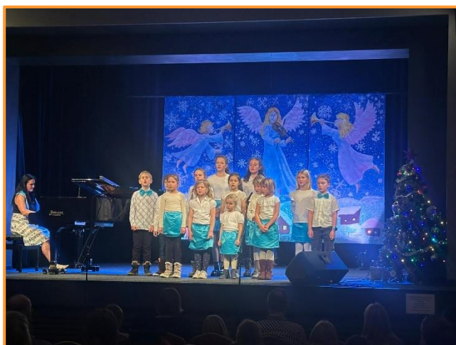
Vánoční koncert KC Labuť 12.12.2023