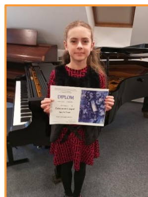
Okresní soutěž MŠMT 1.3.2024