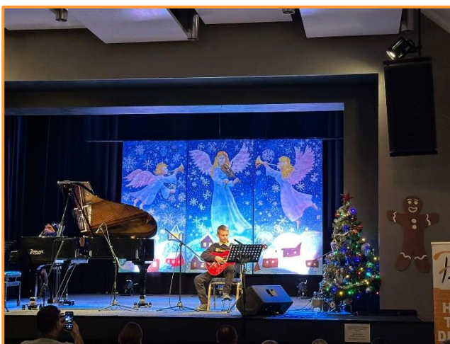
Vánoční koncert KC Labuť 12.12.2023