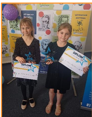
Větrnická notička 29.5.2024