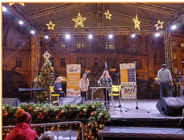
Vánoční trhy na Staroměstském náměstí 14.12.2023