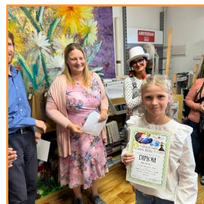
Výtvarná soutěž Čarodějky Kbelky 11.6.2024