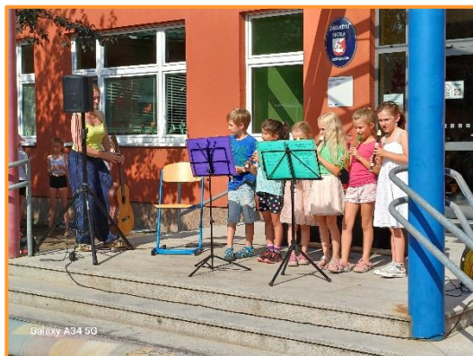
Zahradní slavnost ZŠ Šestajovice 25.6.2024