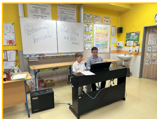
Interní koncert v ZŠ Světice 14.11.2023