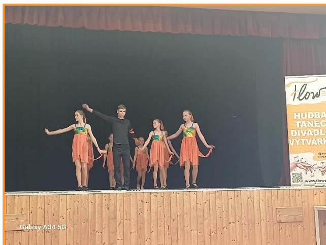
Akademie SKC Ondřejov 27.4.2024