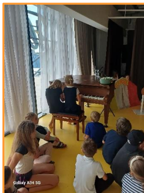
Týdenní kreativní workshop 8.-12.7.2024