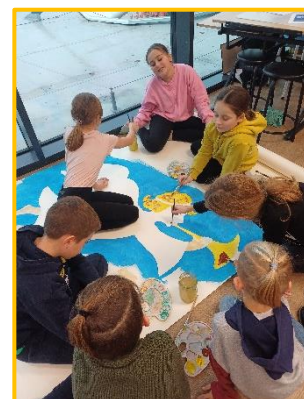
Tvorba Vánoční výzdoby 22.11.2023