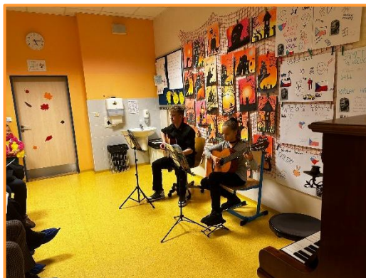
Interní koncert v ZŠ Šestajovice 29.11.2023