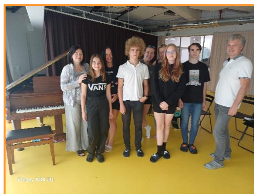
Klavírní workshop 4.7.2024