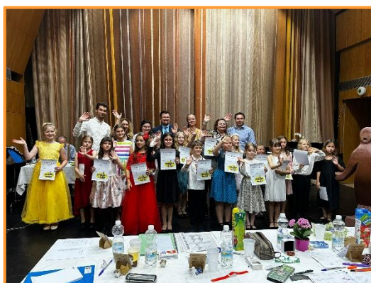
Pražský pěvec 31.5.2024