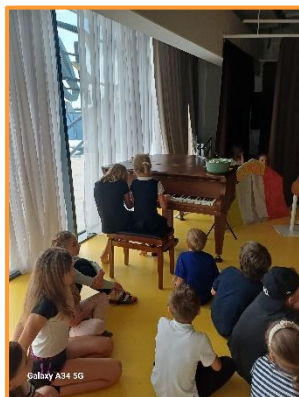
Týdenní kreativní workshop 8.-12.7.2024