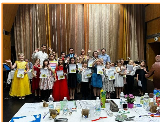
Pražský pěvec 31.5.2024