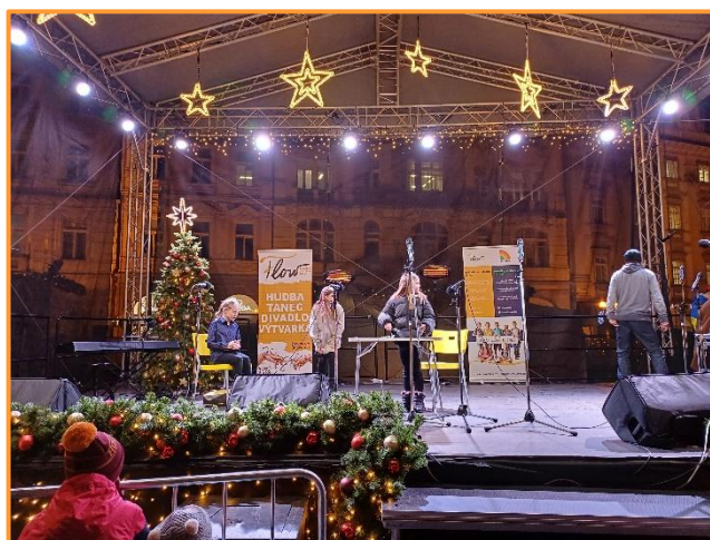
Vánoční trhy na Staroměstském náměstí 14.12.2023