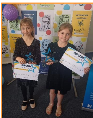
Větrnická notička 29.5.2024