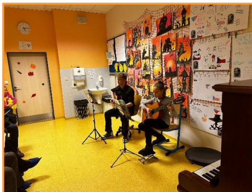
Interní koncert v ZŠ Šestajovice 29.11.2023