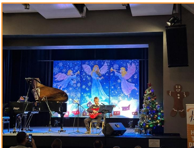
Vánoční koncert KC Labuť 12.12.2023