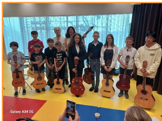
Interní koncert kvtarového oddělení 23.5.2024