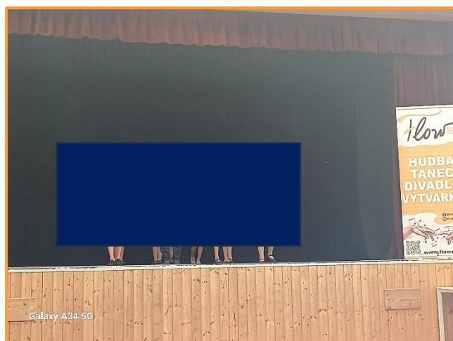
Akademie SKC Ondřejov 27.4.2024