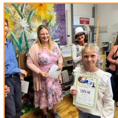
Výtvarná soutěž Čarodějky Kbelky 11.6.2024