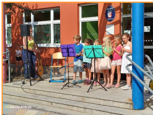
Zahradní slavnost ZŠ Šestajovice 25.6.2024