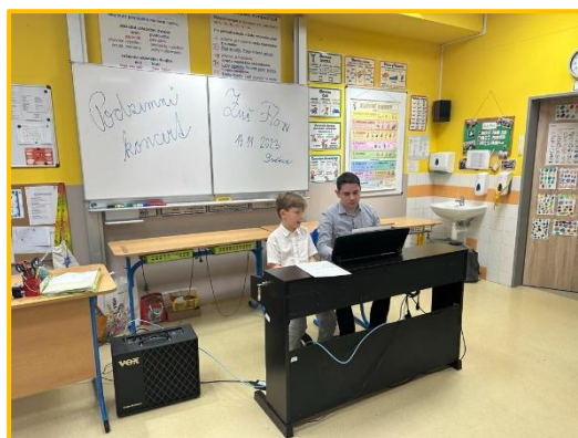
Interní koncert v ZŠ Světice 14.11.2023