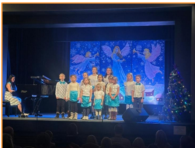
Vánoční koncert KC Labuť 12.12.2023