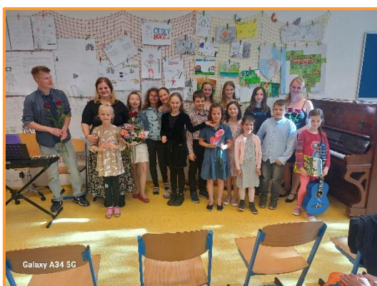
Interní koncert v ZŠ Šestajovice 22.5.2024

Výhled na školní rok 2024/2025 pro Základní uměleckou školu FLOW – Základní umělecká škola a středisko volného času se nese v duchu pokračujícího rozvoje a inovací v oblasti výuky i mimoškolních aktivit. Naším cílem je i nadále poskytovat kvalitní vzdělání v oblasti umění a kultury, podporovat kreativitu žáků a rozvíjet jejich individuální talenty. V nadcházejícím roce se zaměříme na modernizaci výukových metod a nabídku nových kurzů, které budou reflektovat aktuální trendy v uměleckých oborech. Chceme i nadále podporovat spolupráci s místními institucemi a organizacemi, čímž obohatíme kulturní život komunity. S těmito cíli v následujícím školním roce očekáváme nejen kvalitní pedagogické výsledky, ale i úspěšné realizace projektů, které přispějí k rozvoji mladých umělců a kulturního rozvoje.