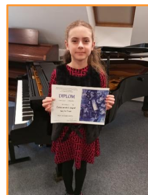
Okresní soutěž MŠMT 1.3.2024