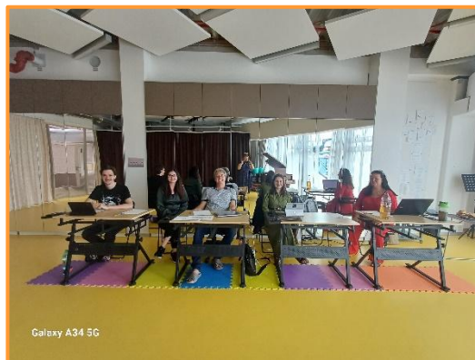
Talentové zkoušky 27-31.5.2024