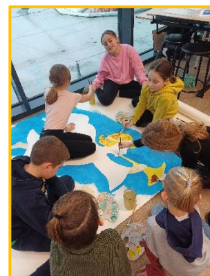
Tvorba Vánoční výzdoby 22.11.2023