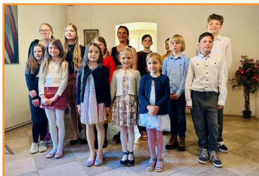
Koncert Ondřejov, 05/25

Školní rok 2024/2025 byl pro naši školu skutečně výjimečný a plný úspěchů. Rádi bychom poděkovali všem žákům za jejich píli a nadšení, učitelům za jejich neúnavnou práci a rodičům za podporu a spolupráci, která je pro nás nenahraditelná. Díky společnému úsilí se nám podařilo dosáhnout mnoha cílů a vytvořit prostředí, ve kterém se každý mohl rozvíjet. Těšíme se na další výzvy, které nám přinese následující školní rok.