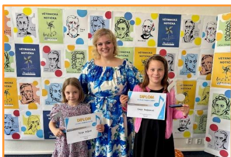
Větrnická notička 29.5.2024