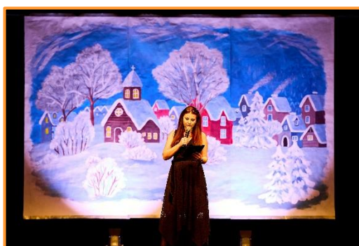
Vánoční koncert, KC Labuť, 12/2024