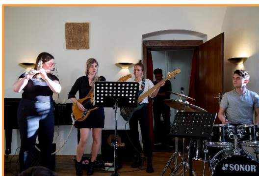
Koncert učitelů, Chodovská Tvrz, 04/25

Výhled na školní rok 2025/2026 pro Základní uměleckou školu FLOW – Základní umělecká škola a středisko volného času se nese v duchu pokračujícího rozvoje a inovací v oblasti výuky i mimoškolních aktivit. Naším cílem je i nadále poskytovat kvalitní vzdělání v oblasti umění a kultury, podporovat kreativitu žáků a rozvíjet jejich individuální talenty. V nadcházejícím roce se zaměříme na modernizaci výukových metod a nabídku nových kurzů, které budou reflektovat aktuální trendy v uměleckých oborech. Chceme i nadále podporovat spolupráci s místními institucemi a organizacemi, čímž obohatíme kulturní život komunity. S těmito cíli v následujícím školním roce očekáváme nejen kvalitní pedagogické výsledky, ale i úspěšné realizace projektů, které přispějí k rozvoji mladých umělců a kulturního rozvoje.