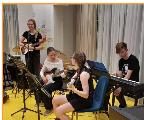
Interní koncert, zima 2025