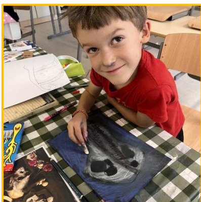
Haloweenská tvorba, podzim 2024