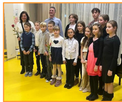
Interní koncert, 12/24