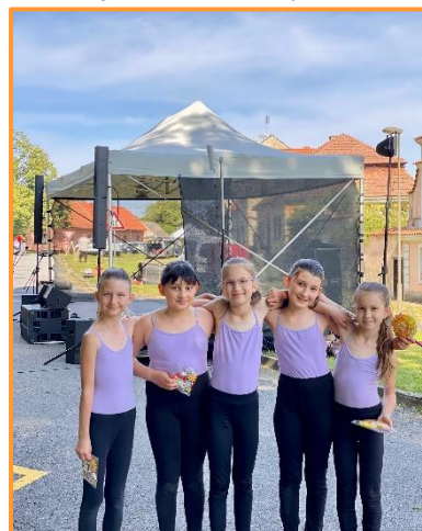
Taneční vystoupení v Ondřejově, červen 2025