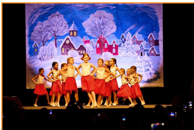
Vánoční koncert Ondřejov, prosinec 2024