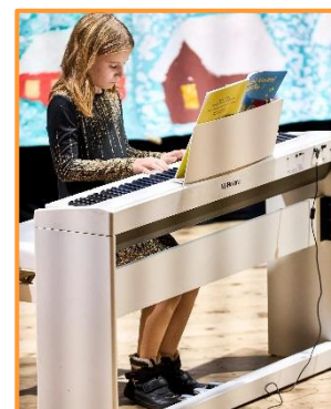
Vánoční koncert, Ondřejov, 12/2024