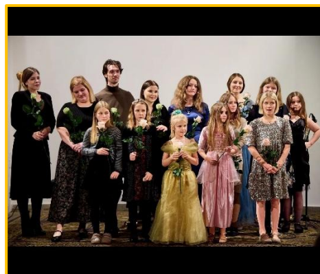
Benefiční koncert, listopad 2024