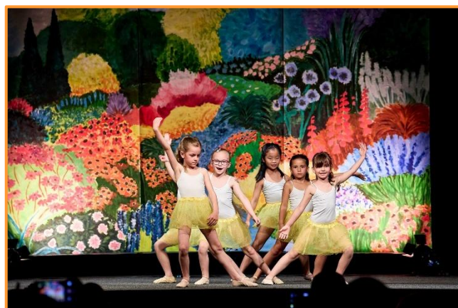
Závěrečný koncert KC Labuť, červen 2025