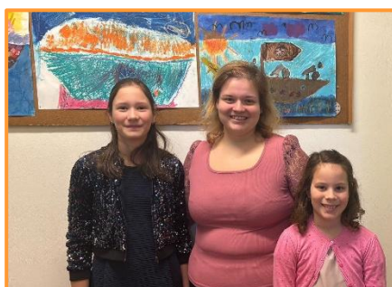
Pražský pěvec 31.5.2024