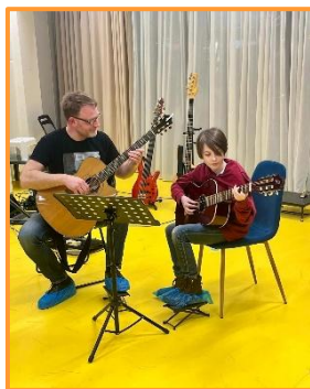
Interní koncert, jaro 25