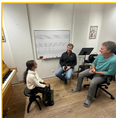
Konzultace ve třech, podzim 2024