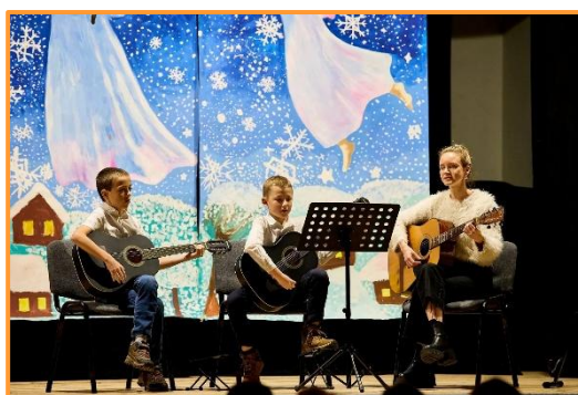
Vánoční koncert, Ondřejov, 12/2024