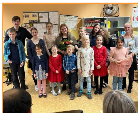
Klavírní workshop 4.7.2024