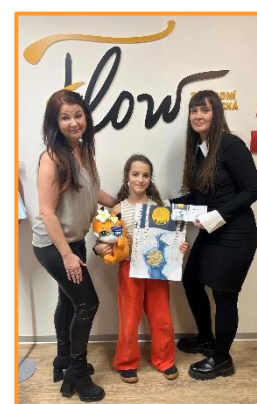
Výherce interní soutěže PF 25

Během roku bylo organizována taktéž celá řada interních koncertů a přehrávek pro rodiče žáků.