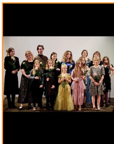
Benefiční koncert, listopad 2024